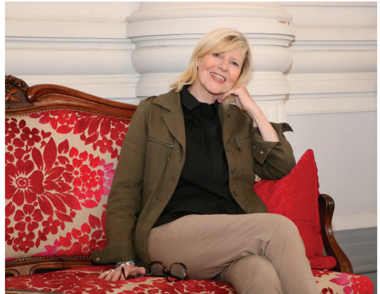
Passionnée de l'œuvre de Saint-Exupéry, et ambassadrice de l'association Nous les ambitieuses Chantal Ladesou soutient ce concours d'écriture.