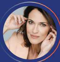
Linda HARDY Actrice Ambassadrice Pays de La Loire