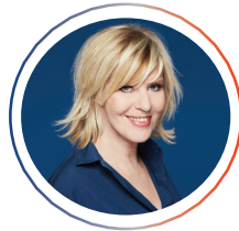
Chantal LADESOU Actrice

« Il faut se battre pour aider ceux qui sont seuls. Il faut aimer les autres, les regarder, les écouter, les entendre et surtout ne pas les lâcher. Ne laisser personne sur le bord de la route. Nous avons toutes à transmettre et avec Nous Les Ambitieuses !, c'est notre ambition et notre volonté ! »