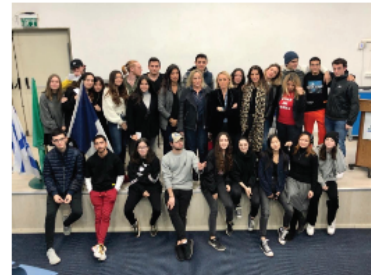
Musée Tsahal avec les élèves du lycée Mikvé Israël

Première étape pour les audacieuses, comprendre pourquoi Israël, qui s'est construit dans une logique sécuritaire, se redéfinit d'abord comme une start-up nation. Ici, le gouvernement mène une politique volontariste dans le domaine de la recherche et du développement, et les enfants sont familiarisés à la technologie dès leur plus jeune âge. S'ajoute à cela la valorisation continue de la prise de risque, avec notamment une culture forte de l'entrepreneuriat, mais aussi le service militaire. En effet, l'armée peut être l'opportunité de suivre des formations pointues dans le domaine des nouvelles technologies ou de l'électronique. Tous ces éléments constitueraient une partie des facteurs du succès d'Israël qui s'impose aujourd'hui comme une véritable start-up nation. Le pays se distingue dans plusieurs domaines clés pour les générations futures, comme celui de la cybersécurité, de l'intelligence artificielle, de la santé, en passant par les GreenTech. Ainsi, moteur d'innovation et à la pointe des nouvelles technologies, Israël participe de façon concrète à la construction du monde de demain.