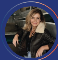
Dorine BOURNETON Aviatrice - Ecrivaine Ambassadrice Auvergne Rhone Alpes