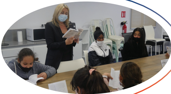
Atelier de lecture "Le Petit Prince" en partenariat avec l'association Antoine de Saint Exupery