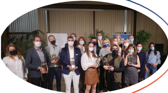
Première édition de la Journée nationale "Des Gestes Audacieux" le 17 mars 2021