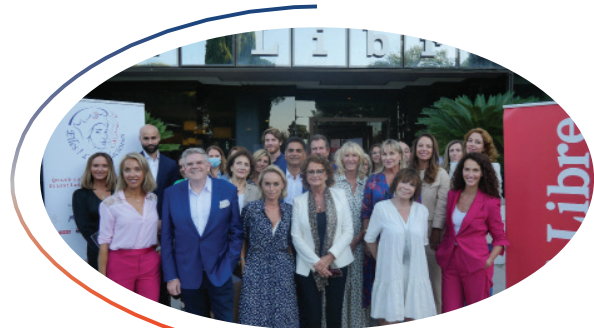
Rentrée 2020 au sein de Midi Libre