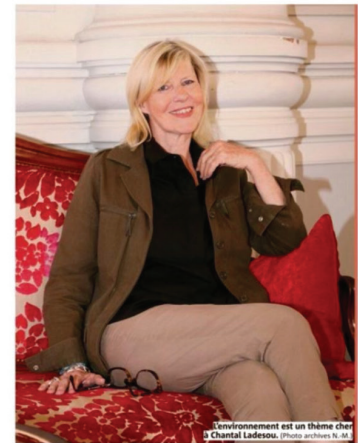
L'environnement est un thème cher à Chantal Ladesou.

C'est une cause qui vous tient à cœur ? Absolument. Nous pouvons tous faire quelque chose à notre échelle mais beaucoup de gens ne font pas attention. Par exemple, on utilise beaucoup trop de produits dans nos machines à laver. On peut très bien laver avec peu de produit, et ça polluarait beaucoup moins les rivières phéarétiques. Chacun d'entre nous peut faire quelque chose.