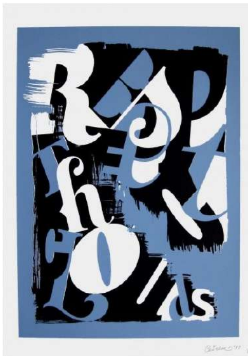
© Respect the cloud - Pieter Ceizer

Cette technique permet aux plus jeunes d'accéder facilement à l'écrit, tout en travaillant sur un format imagé.