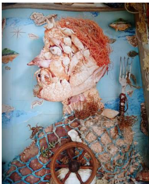
© L'Homme des mers d'Olivier Thiébaud dans Les hommes qui n'en font qu'à leur tête de François David et Olivier Thiébaud

À la manière d'Olivier Thiébaud et d'Arcimboldo dessine ton expérience du repas de la mer en utilisant les aliments comme sur l'illustration et le tableau ci-dessous.