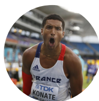
Erwan KONATE Trois fois champion de France de saut en longueur, 3 ème au championnat d'Europe, 2 fois champion du monde en U20