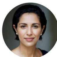
Sarah EL HAÏRY Secrétaire d'État auprès du ministre des Armées et du ministre de l'Éducation nationale et de la Jeunesse,