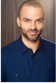
TONY PARKER, AMBASSADEUR DE NOTRE CONCOURS

« Je suis très heureux de prolonger mon engagement pour l'éducation et l'accompagnement de la jeune génération en devenant ambassadeur du Concours d'écriture et de dessin organisé par l'association « Nous les Ambitieuses ! ». Plus particulièrement, la thématique de cette année « Nos actions positives face au harcèlement », fait écho aux actions que nous menons à l'Academy, à la bienveillance qui nous habite au quotidien dans nos relations avec les jeunes, et à la tolérance et la solidarité que nous souhaitons instaurer entre eux. »