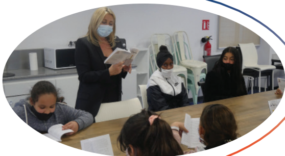
Atelier de lecture "Le Petit Prince" en partenariat avec l'association Antoine de Saint Exupery