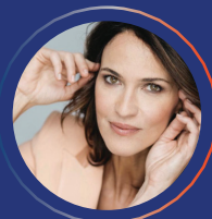
Linda HARDY Actrice Ambassadrice Pays de La Loire