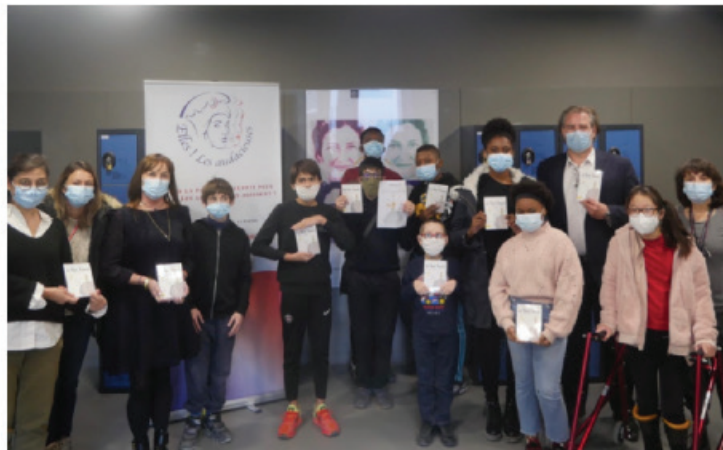
PROFES RECUEILLES PAR DENIS GARDIAUX

Organisée par l'association Elleslesaudacieuses, la cérémonie de la journée des gestes audacieux a pour objectif de récompenser les initiatives altruistes et solidaires.