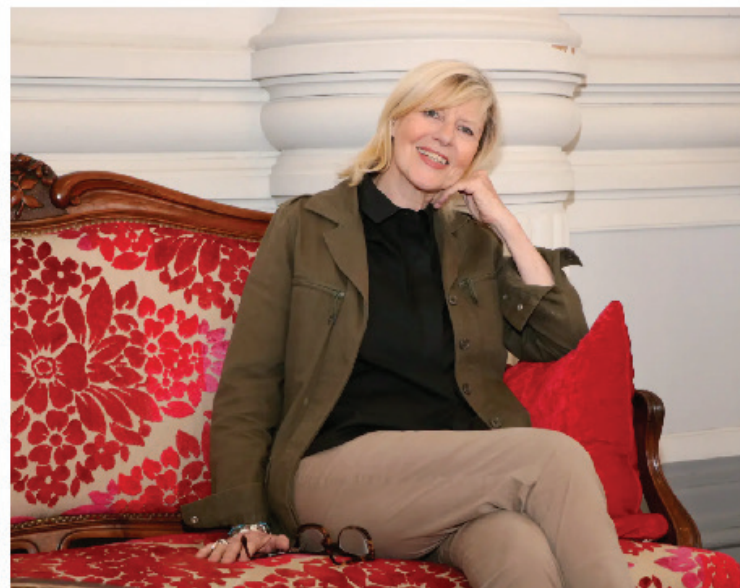
Participer au concours d'écriture et de dessin "Le Petit Prince est revenu", en partenariat avec la Fondation Antoine de Saint-Exupéry pour la Jeunesse pour la Jeunesse et l'association Nous Les Ambitieuses.

FRANCE CULTURE PARLOIR DE MERCIER | N° de série 12-04-2021 11:20 | F22-M4-1124-2021 8:12:00