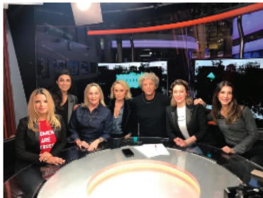
Elles ! Les Audacieuses en 2019

Les retours sont immédiats, des centaines de femmes d'horizons professionnels et géographiques différents, dont des personnalités connues du grand public, s'inscrivent spontanément. Toutes ont en commun l'envie de faire bouger les lignes. Le réseau «Elles ! Les Audacieuses» est né.