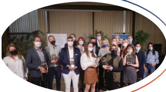
Première édition de la Journée nationale "Des Gestes Audacieux" le 17 mars 2021