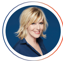
Chantal LADESOU Actrice

« Il faut se battre pour aider ceux qui sont seuls. Il faut aimer les autres, les regarder, les écouter, les entendre et surtout ne pas les lâcher. Ne laisser personne sur le bord de la route. Nous avons toutes à transmettre et avec Nous Les Ambitieuses !, c'est notre ambition et notre volonté ! »