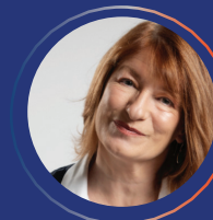
Muriel MAYETTE HOLTZ Directrice du Théâtre National de Nice Ambassadrice Sud PACA