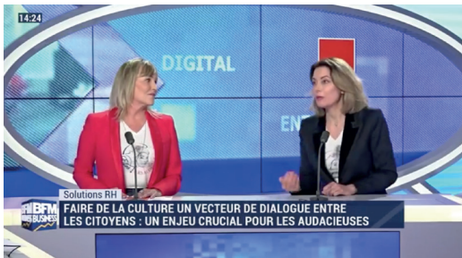
Solutions RH FAIRE DE LA CULTURE UN VECTEUR DE DIALOGUE ENTRE LES CITOYENS : UN ENJEU CRUCIAL POUR LES AUDACIEUSES

https://bfmbusiness.bfmtv.com/mediaplayer/video/club-media-rh-samedi-7-mars-1228354.html