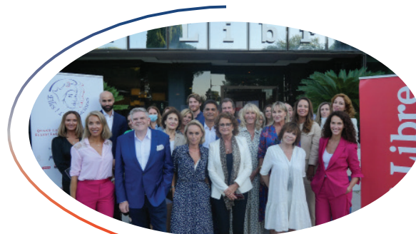
Rentrée 2020 au sein de Midi Libre