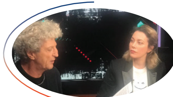
Spectacle mis en scène par Elie Chouraqui et produit par Alexandra Fechner. Mettre en lumière les femmes rencontrées en région