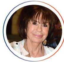
Danièle EVENOU Actrice

« A l'heure où la France traverse une crise sans précédent , il est capital que tous les milieux sociaux, et toutes les communautés puissent se rassembler au travers d'événements culturels fédérateurs car la culture est un formidable vecteur de rassemblement et de fraternité . Si on peut s'amuser ou s'émouvoir ensemble alors nous pourrions dialoguer ! C'est animée par l'amour sincère que je porte aux français que j'ai rejoint « Nous Les Ambitieuses ! » car je souhaite apporter ma connaissance de terrain afin de l'inscrire dans une démarche citoyenne et participative. Ma volonté est de véhiculer un message de rassemblement, favoriser le dialogue, le partage de connaissance ainsi que de travailler à la valorisation de chaque français au travers d'actions culturelles fortes »