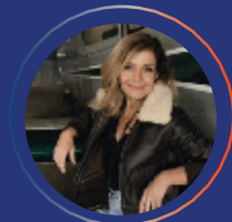
Dorine BOURNETON Aviatrice - Ecrivaine Ambassadrice Auvergne Rhone Alpes