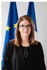
MINISTÈRE CHARGÉ DE L'ÉGALITÉ ENTRE LES FEMMES ET LES HOMMES ET DE LA LUTTE CONTRE LES DISCRIMINATIONS Liberté Égalité Fraternité